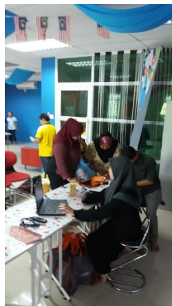
Figure 5 : Keusahawanan (masukkan produk dalam MyShop)