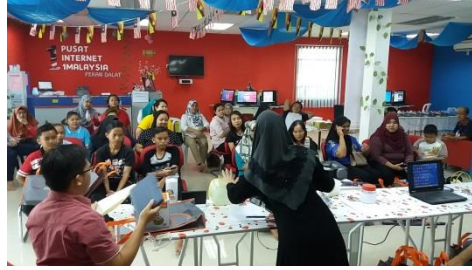
Figure 2: Program sedang dijalankan