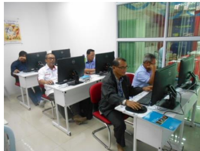
Figure 4 : kelas Microsoft /pengenalan internet & emel