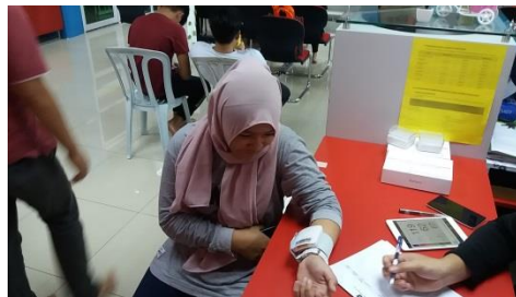
Figure 3: pemeriksaan kesihatan.