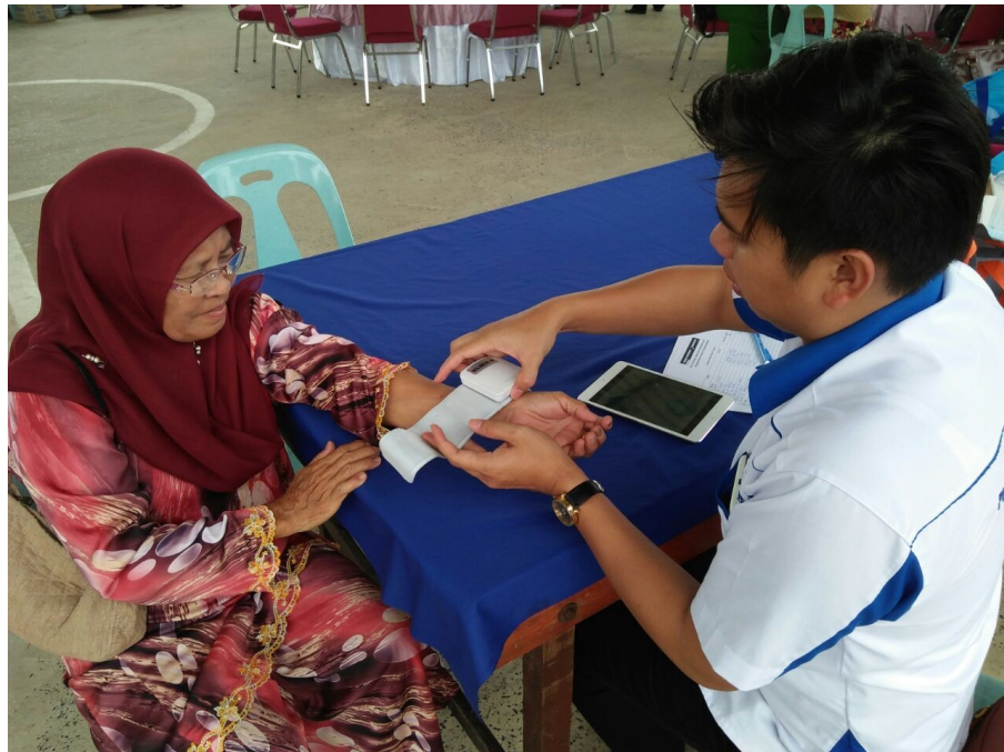
Gambar 3 : I-Health