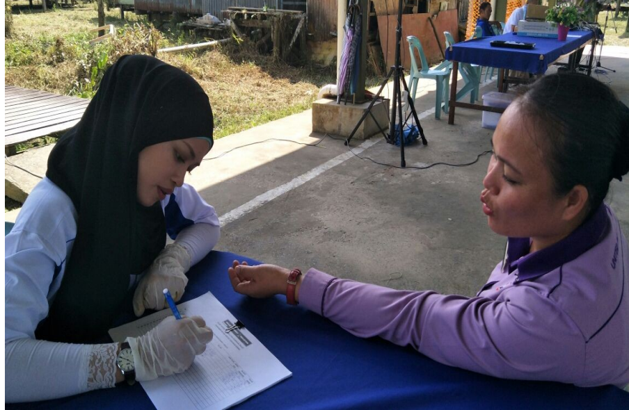
Gambar 2 : I-Health